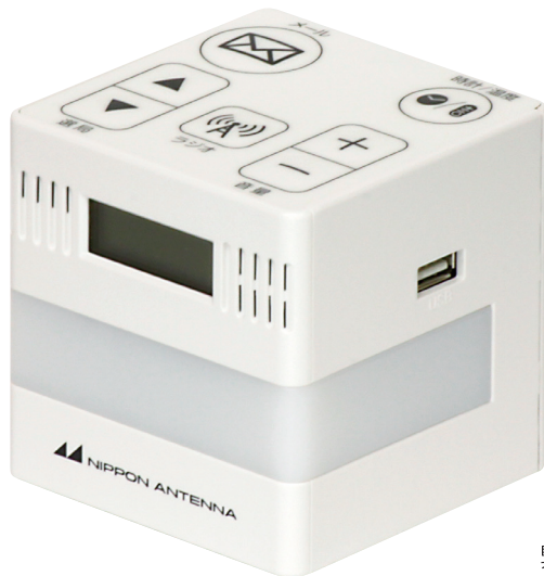
緊急地震速報端末装置 NEJ751