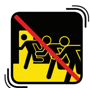
あわてて外に 飛び出さない