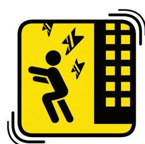
落ちてくる ものに注意