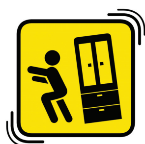
家具からはなれる